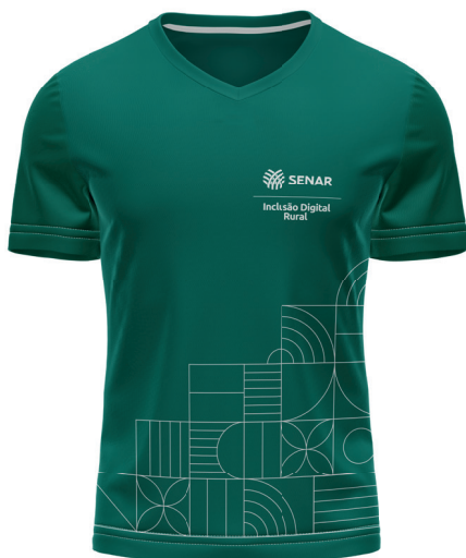
F R E N T E